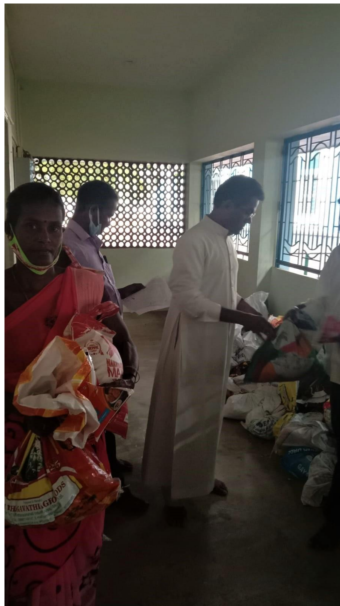
Het uitdelen van noodpakketten tijdens de coronapandemie